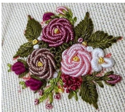
Broderies variées avec Yolanda