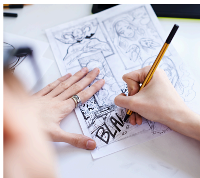
Bande dessinée et carnet de croquis

Venez essayer gratuitement des cours et ateliers d'art ainsi que des cours liés au bien-être. Des professeurs du CVML vous initieront via des démonstrations à des univers de créativité et de mouvement pour vous aider à découvrir et développer de nouveaux centres d'intérêts.